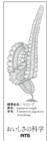
マコンブマグネット